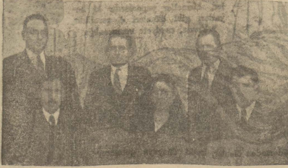
Ergani Osmaniyesinin ilköğretim muallimleri

Bu gün bu şehir tamamen değişmiştir. Bembeyaz binaları ile Osmaniyeye yeni bir kasaba gibi göze çarpmaktadır. Kasabada güzel oteller, temiz lokantalar tes edilmiş, şoseler, yollar tamir olunmuştur. Osmaniyede 600 evce 1500 nüfus barınmaktadır. Kasaba Diyaribekire 60 kilometre mesafede ve Diyaribekir - Elâziz yolu üzerindedir. İşlek bir uğrak vaziyetindedir. Üzüm istisbali gayet çok ve bağları pek muntazamdır. Osmaniyeye şarabının kendine mahsus bir hususiyeti vardır. Şimendifer yolunun 26 nci kısmı bu kasabanın civarından geçmektedir. Burada inşaat faaliyeti pek ilerlemiş olduğu için bugünlerde kasaba da kalabalıklaşmıştır. Kaymakam Bay Hayri