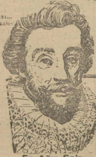
En Ağır Şair.. François de Malherbe'dir. (1629-1555) yıl- ları arasında yalnız bir misra yazmıştır.