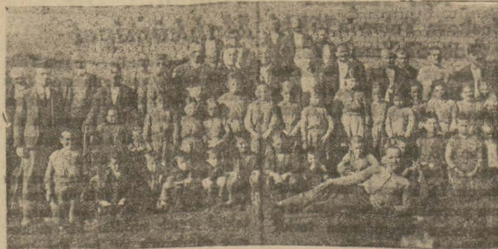
Gemlikte bir köy mektebinin çocukları hocaları ve babaları ile beraber

Gemlik (Hususî) — Burada Salı günleri pazar kurulmaktadır. Geçen hafta bir şayia çıkmış, pazarda satış yapabilmeleri için çarşaf geylimemesi lâzımgeldiği söylenmiştir. Bu şayia asilsiz olmakla beraber Gemlik kadınları arasında seviac uyandırmış, hemen bütün kadınlar çarşafı bırakıp manto geymişler, bu suretle çarşaf belâsından kurtulmuşlardır.