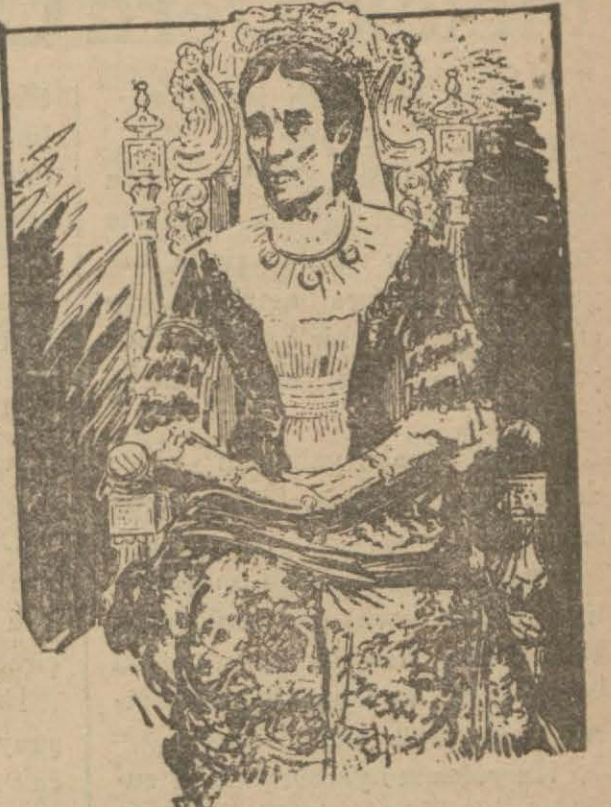
Ranavalona III (1862 - 1922) Madagaskar Kraliçesi Tebasının gözünde (Allahın görünüş şekli) olarak telâkki edilirdi. Kraliçenin hristiyanlığı kubul etmiş olmasına rağmen halkı arasından bu İttikadı kaldırmak için yaptığı teşebbüsler neticesiz kaldı ve bir deneme sayıldı.

Dünyanın en dar caddesi.. Londra'da Parlamento sokağıdır, içinden an- cak bir adam geçebilir.