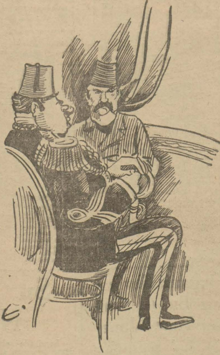
Seyirciler arasında yaverihâs paşa

— Evlâdeğime ne oldu?.. Gözünü mü kör ettiler? Kolunu, bacağı mı kırdılar?.. Yoksa